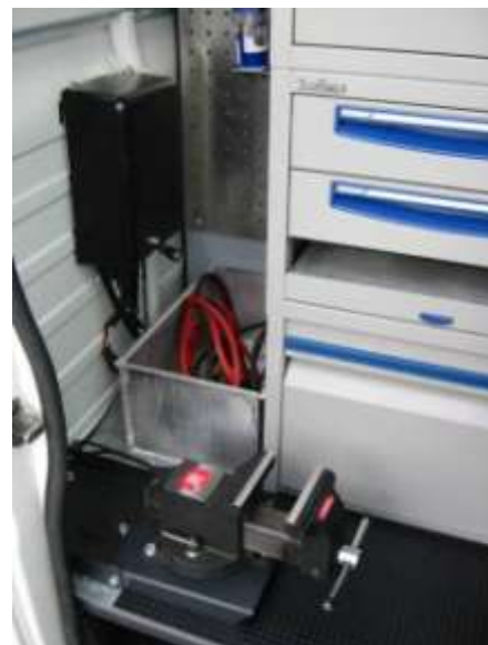
Equipement Atelier pour châssis double cabine