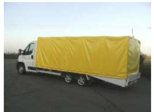
▲ Transport confidentiel