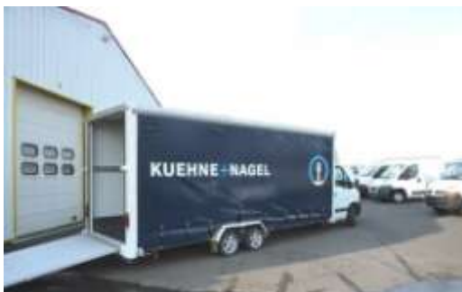
▲ Transport de voitures