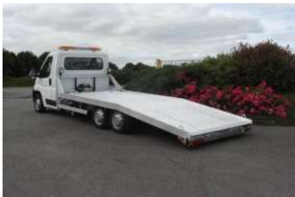
Portair GR – PTAC 3500 kg à 6 500 kg