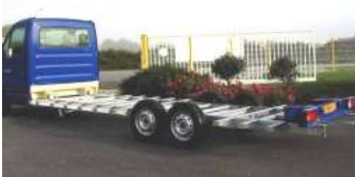
◀Châssis pour caisses, plateaux, camion magasins, ▶, etc...