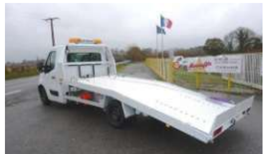
Portair SE - PTAC 3500 kg