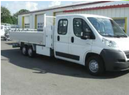
▲ Transport de matériel pour entretien espaces verts

PTAC jusqu'à 6.5 T Longueur carrossable jusqu'à 8 m avec ou sans passage de roues Châssis assure une excellente stabilité du véhicule