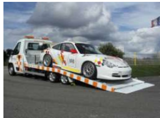
Portair – PTAC 3500 kg - 5100 kg