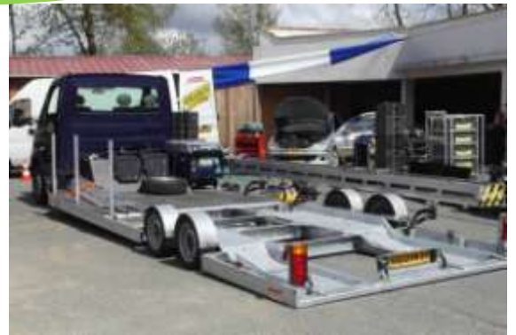
▲ Véhicule cinéma