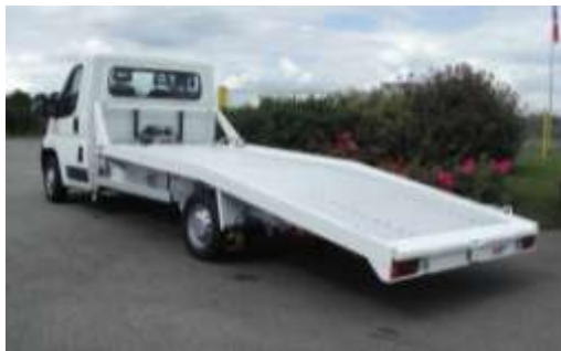
Portfix – PTAC 3500 kg

Un chargement facile et très bas Une gamme du VL au PL Une charge utile de 1 125 kg à 2 800 kg